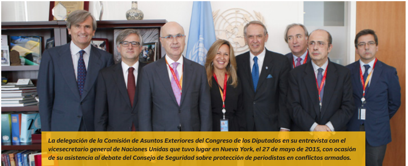
La delegación de la Comisión de Asuntos Exteriores del Congreso de los Diputados en su entrevista con el vicesecretario general de Naciones Unidas que tuvo lugar en Nueva York, el 27 de mayo de 2015, con ocasión de su asistencia al debate del Consejo de Seguridad sobre protección de periodistas en conflictos armados.

nuevos retos, como el impacto y el papel de las mujeres en la lucha contra el terrorismo; y consagra el compromiso renovado del sistema de NNUU y del Consejo con la agenda de MPS.