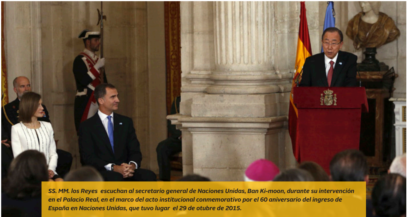
SS. MM. los Reyes escuchan al secretario general de Naciones Unidas, Ban Ki-moon, durante su intervención en el Palacio Real, en el marco del acto institucional conmemorativo por el 60 aniversario del ingreso de España en Naciones Unidas, que tuvo lugar el 29 de octubre de 2015.