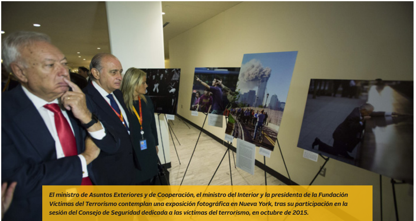
El ministro de Asuntos Exteriores y de Cooperación, el ministro del Interior y la presidenta de la Fundación Víctimas del Terrorismo contemplan una exposición fotográfica en Nueva York, tras su participación en la sesión del Consejo de Seguridad dedicada a las víctimas del terrorismo, en octubre de 2015.

permite inspeccionar y, en su caso, tomar medidas contra los buques que se dediquen al tráfico de migrantes y la trata de personas en el Mediterráneo frente a las costas de Libia.