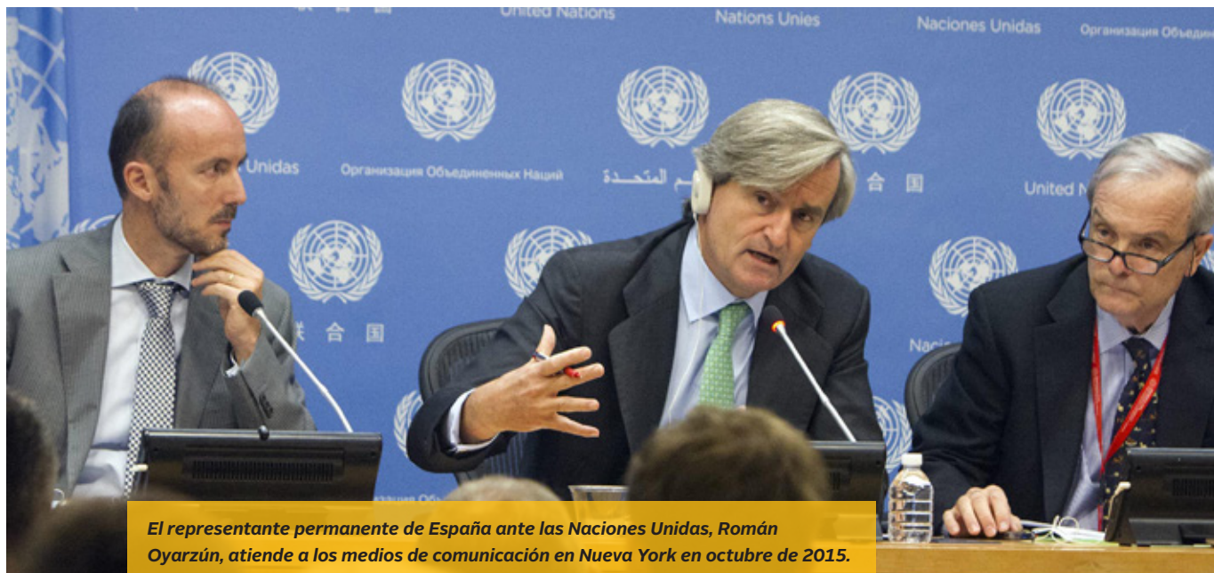
El representante permanente de España ante las Naciones Unidas, Román Oyarzún, atiende a los medios de comunicación en Nueva York en octubre de 2015.

Madrid y extendido ese ejercicio a otras capitales; y hemos dedicado especial empeño a la dimensión europea, informando regularmente a los socios en Nueva York y en Bruselas y recabando su opinión con regularidad en relación con los temas centrales de la Política Exterior y de Seguridad Común (PESC), de acuerdo con lo previsto en el artículo 34 del Tratado de la Unión Europea.