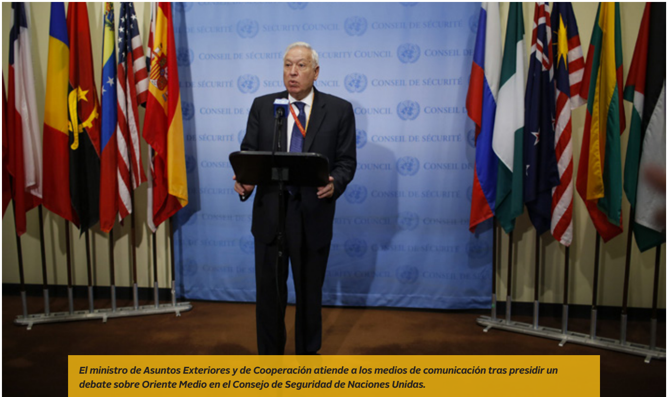
El ministro de Asuntos Exteriores y de Cooperación atiende a los medios de comunicación tras presidir un debate sobre Oriente Medio en el Consejo de Seguridad de Naciones Unidas.